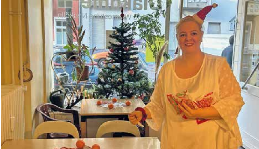
Liebevoll dekoriert: die Tee- und Wärmestube vor der Weihnachtsfeier 2023

Für obdachlose und bedürftige Menschen ist der Winter eine besonders harte Zeit: Eiseskälte, fehlender Schutz und die allgegenwärtige Einsamkeit machen das Leben auf der Straße noch schwieriger. An Weihnachten, einem Fest der Gemeinschaft und Wärme, wird diese Not oft besonders spürbar. Umso wichtiger sind Orte wie die Tee- und Wärmestube Neukölln und das Diakoniehhaus Britz, die an den Feiertagen ein Zeichen der Solidarität setzen.