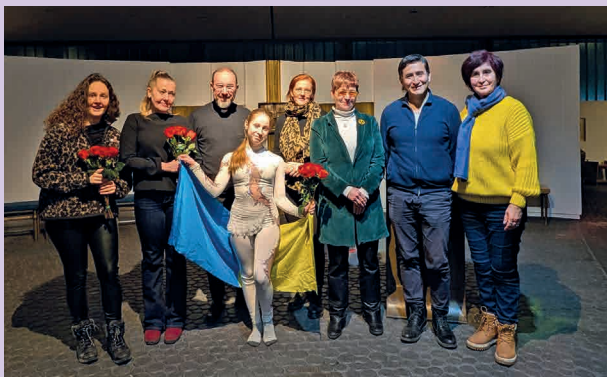
Jeden 3. Freitag im Monat lädt das Vorbereitungsteam zu den Friedensgebeten in die Dreieinigkeitskirche, Lipschitzallee 7